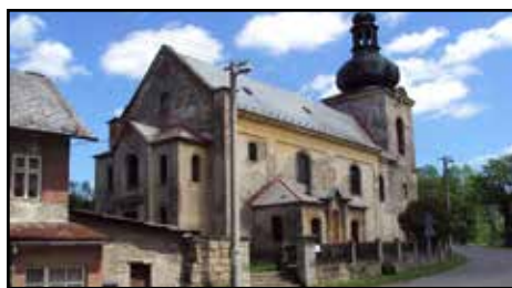
Kostel sv. Jiří v Dobranově

Zdroj: Wikipedia, vlastní archiv, poděkování patří za korekturu k historii Ing. Jaroslavu Panáčkovi Zdeněk Rydygr