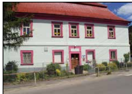
Fara v Dobranově, dnes mateřská škola

Směrem na Českou Lípou byla dále zbourána bývalá zemědělská velkovýkrmna. Na uvolněném místě vznikly v roce 2018 dvě nové výrobní haly, sloužící k výrobě komponentů pro automobilový průmysl. V jedné sídlí čínská firma Ning-