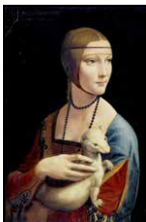
Dáma s hranostajem