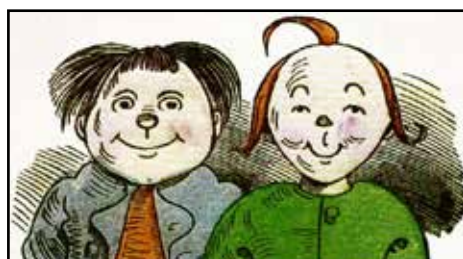
Buschův Max a Moritz

V souvislosti s letošním jubileem Čtyřlístku se vrátíme k počátkům komiksu ve světě a u nás. Komiks má kupodivu dlouhou historii, za jeden z prvních lze počítat třeba Trajánův sloup v Římě, který v nepřetržitě vinoucím se pásu zaznamenal dobovatelské úspěchy tohoto římského císaře. Nebo třeba slavná tapisérie z Bayeux, zobrazující dobytí Británie Normany roku 1066. Opravdové „komiksy“ ovšem vznikly po vynálezu knihtisku. Tak v roce 1460 bylo vydáno Utrpení svatého Erasma. A z opačného konce – v roce 1731 vyšla v Anglii série rytin Dráha prostitutky a Dráha zhýralce autora Wiliama Hogartha.