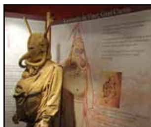
Skafandr podle Leonardova vynálezu