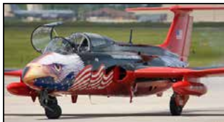
Dnešní Delfin amerického majitele