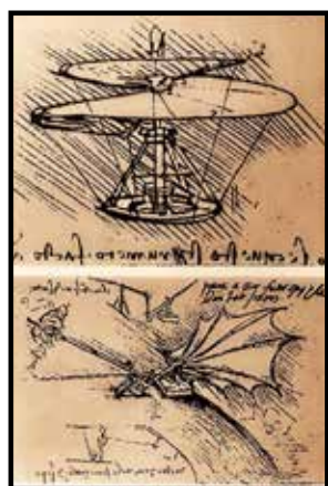
Nákresy létacích strojů