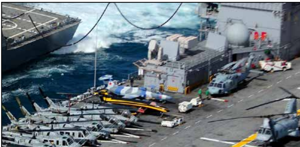
L-29 v amerických vojenských službách

byla postavena jen v jednom exempláři. L-29R byl průzkumný letoun s kamerami pod přídílí. Tato letadla byla vybavena přídatnými palivovými nádržemi na koncích křídel, která vedla po letech provozu k mikroprasklinám nosníku křídel. 31 letadel proto bylo u nás odstraněním těchto nádrží konvertováno na verzi L-29RS. Z české a slovenské armády byly již vyřazeny, z centra výcviku v Pardubicích zmišely v roce 2003. Třeba americká armáda